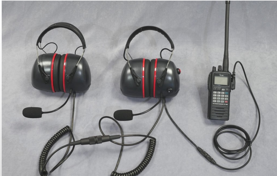
INTEGRA PREMIUM S3

Idéal pour ceux qui changent souvent de machine ou qui ne veulent pas d'installation fixe. Désormais disponible en version PREMIUM S3, avec une insonorisation moyenne de 37dB En version serre-têtes ou avec casques de protection