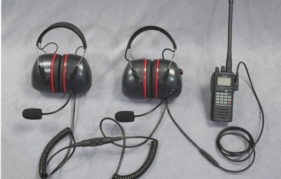
INTEGRA PREMIUM S3

Idéal pour ceux qui changent souvent de machine ou qui ne veulent pas d'installation fixe. Désormais disponible en version PREMIUM S3, avec une insonorisation moyenne de 37dB En version serre-têtes ou avec casques de protection