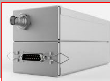
Version slim paysage

Pour tout autre modèle de radio, nous consulter pour prix et disponibilité.